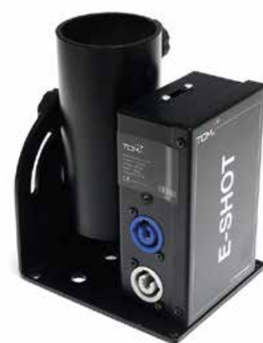
CONFETTI E STREAMER EFFECT