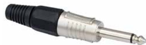
PLUG E JACK