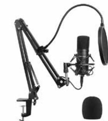
MICROFONI A FILO