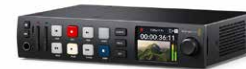
PLAYERS E RECORDER