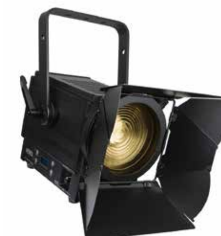
STAGE, THEATRE E KEY LIGHT