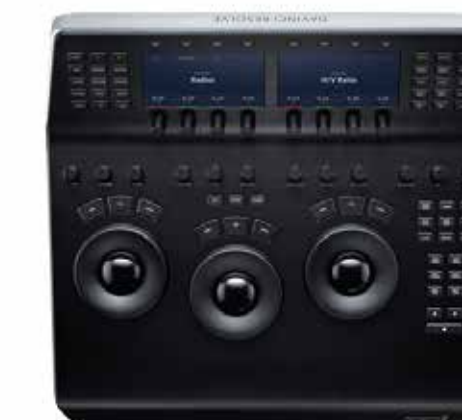
VIDEO EDITING E POST-PRODUZIONE