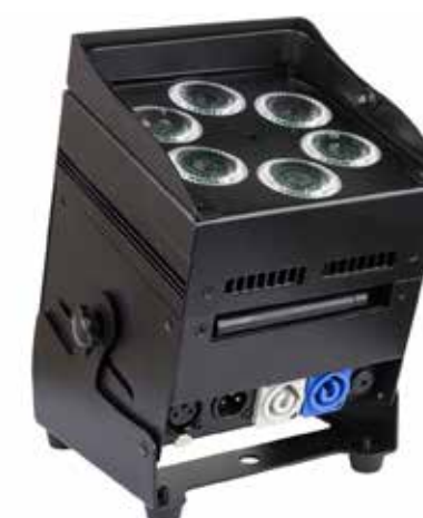
FARI A BATTERIA