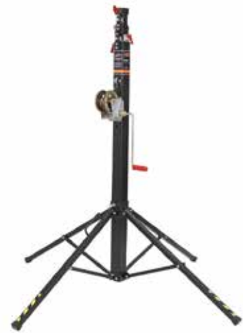
PROFESSIONAL TOWER E STAND