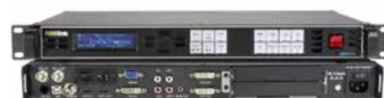
VIDEO SIGNAL PROCESSING E MANAGEMENT