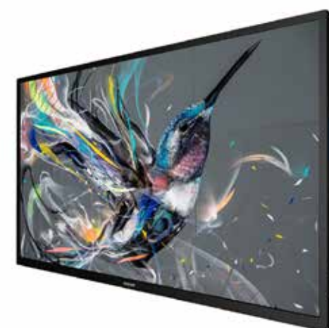
MONITOR E DISPLAY