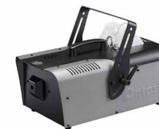
SMOKE E LOW SMOKE EFFECT