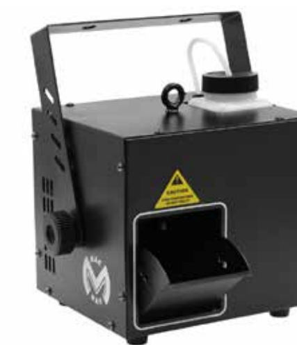
HAZE E FAZE EFFECT