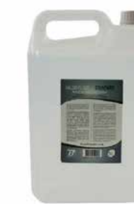
CONSUMABILI E ACCESSORI