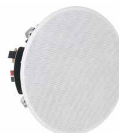
SISTEMI PA PER INSTALLAZIONI