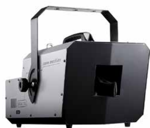
SNOW E FOAM EFFECT