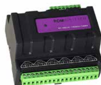
DMX E LIGHTING TOOL